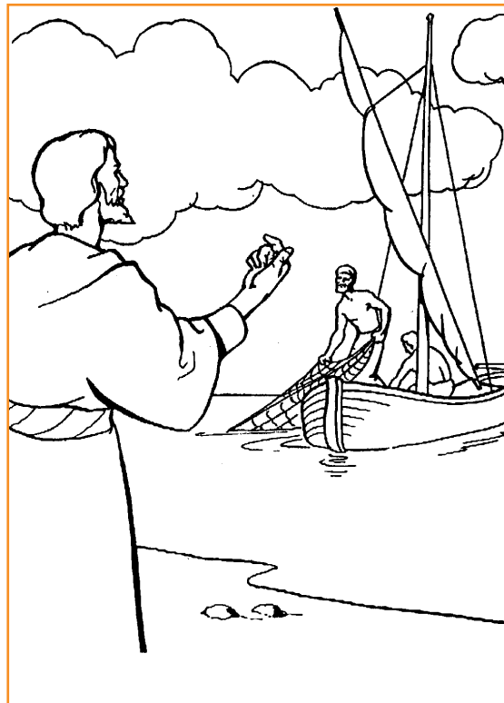
Vybarvi obrázek, na kterém je Pán Ježíš a rybáři.

Pán Ježíš je k sobě přivolal a řekl jim, aby ho následovali. Okamžitě nechali své sítě být a šli za ním. Dnes Pán Ježíš chce, aby ho stejným způsobem následovali kluci a děvčata, jako jsi Ty nebo Tvůj kamarád. Jsi připraven/a ho poslechnout?